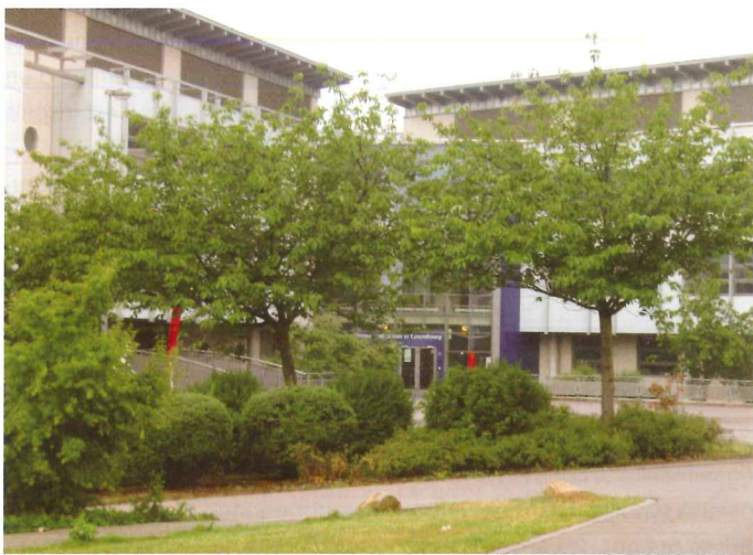
L'International School of Luxembourg (ISL).

Il suffit de se promener à Luxembourg à certaines heures stratégiques (13h ou 17h) pour mesurer à quel point la ville est jeune. De nombreux collèges et lycées attirent des adolescents venus parfois de loin. La tendance est aux projets d'agrandissement des établissements, notamment dans les écoles internationales. Nous avons rencontré les directeurs de trois d'entre elles.