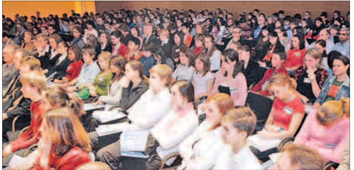
Rund 300 Schüler nahmen an der Konferenz teil.